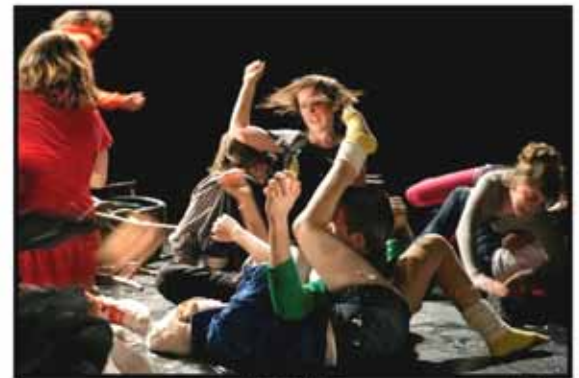
PUBERS BESTAAN NIET