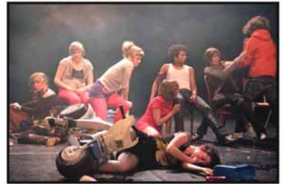
PUBERS BESTAAN NIET

http://www.ontroerendgoed.be/ http://www.kopergeitery.be/details.php?vsID=3 http://www.undertheradarfestival.com/index.php?s=2#17 http://www.guardian.co.uk/culture/2008/aug/14/edinburghfestival.onceandforall http://living.scotsman.com/13870/Theatre-review-39Once-and-for-4397413.jp http://www.timeoutsydney.com.au/theatre/event/11102/once-and-for-all-were-gonna-tell-you-who-we-are-so-shut-up-and-listen.aspx http://latimesblogs.latimes.com/culturemonster/2009/11/once-and-for-all-were-gonna-tell-you-who-we-are-so-shut-up-and-listen-at-freud-playhouse.html http://theater.nytimes.com/2010/01/11/theater/reviews/11once.html