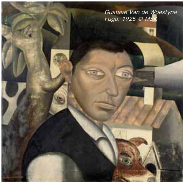
Gustave Van de Woestyne Fuga, 1925 © MSK