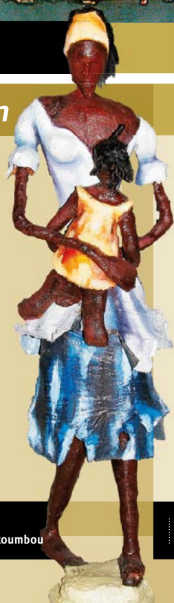
Kind aan de borst Rhode Bath-Schéba Makoumbou