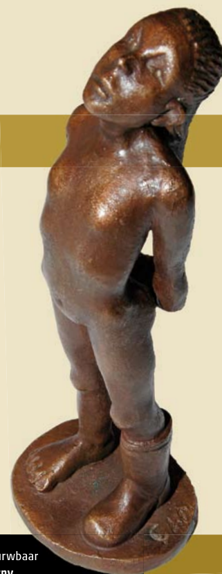
Onvermurwbaar Gigi Warny