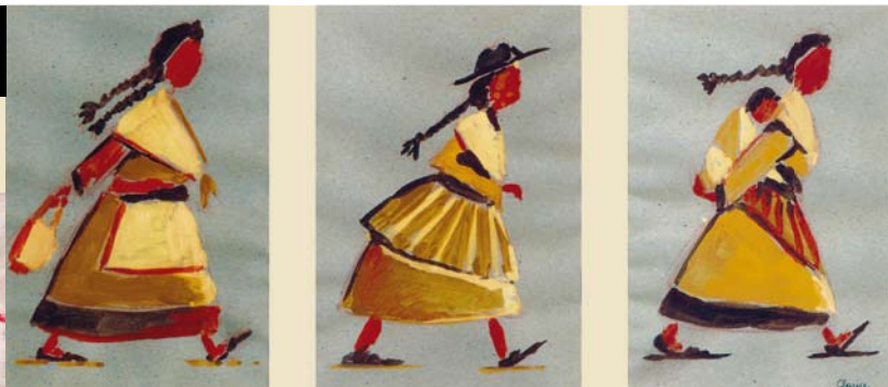
De latinas Clarice

Op een dag zullen mannen en vrouwen gelijk zijn omdat, als mannen en vrouwen gelijk geboren worden en sterven, ik niet inzie waarom ze ook niet gelijk zouden leven.