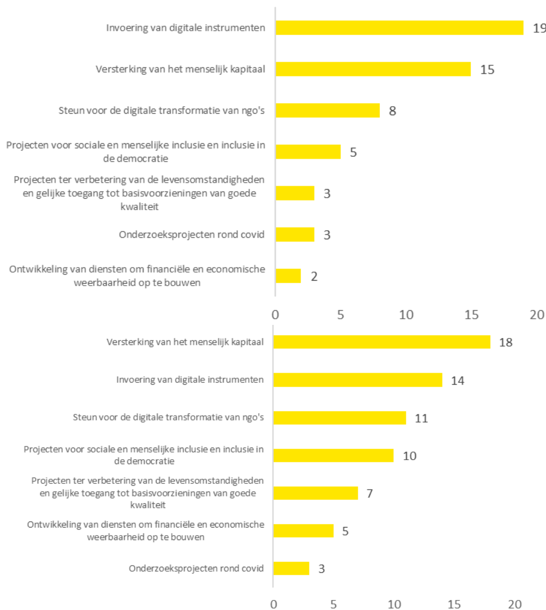
Figuur 3 Voorbeelden van Belgische gouvernementele (bovenaan) en niet-gouvernementele (onderaan) samenwerkingsinterventies in antwoord op de Covid-19-crisis (meerkeuzevraag)