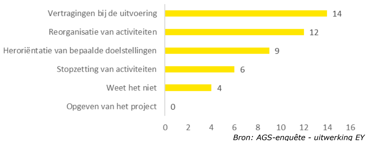
Figuur 1 Impact van de Covid-19-crisis op de uitvoering van D4D-interventies door actoren van de gouvernementele ontwikkelingssamenwerking (Q5, 25 respondenten, meerkeuzevraag)

De Covid-19-crisis heeft een transversaal effect gehad, met name op het tempo van de uitvoering van projecten, waarvan de meeste vertraging hebben opgelopen of zelfs tijdelijk zijn opgeschort, zowel voor de gouvernementele als voor de niet-gouvernementele ontwikkelingssamenwerkingsactoren.